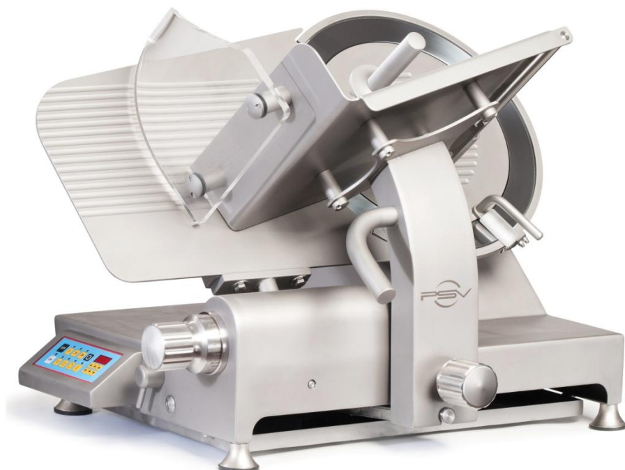
PSX350 – PSX350SA NR